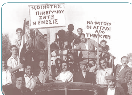
Όλο το Πικέρμι διαδηλώνει για την ένωση της Κύπρου με την Ελλάδα.