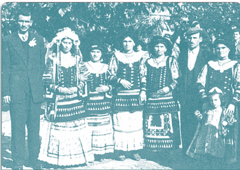
Φωτογραφία γάμου. Από το βιβλίο "Η ζωή και η τέχνη των Σαρακατσάνων". Έκδοση ΕΟΜΜΕΧ.

Στις πρώτες δεκαετίες του 20ού αιώνα, οι ανακατατάξεις στη Βαλκανική έπληξαν τις μετακινήσεις των Σαρακατσάνων νομάδων ποιμένων, με αποκορύφωμα τον αποκλεισμό πολλών ορεινών περιοχών από τον ελληνικό στρατό (1947-1949), που σηματοδότησε και το τέλος του νομαδισμού. Στη δεκαετία του 1950, αφήνοντας πίσω το πανάρχαιο μοντέλο επιβίωσης, την αποκλειστική κτηνοτροφία, σταδιακά αποκτούν ιδιόκτητες εκτάσεις για βοσκή ή ασκούν άλλα επαγγέλματα και ενσωματώνονται πλέον στην ελληνική κοινωνία. Ωστόσο, το ιερό τρίπτυχο των Σαρακατσάνων παραμένει μέχρι σήμερα: Έλληνες-Ορθόδοξοι-Σαρακατσάνοι και απ' όπου κι αν βρίσκονται κρατάνε τα φλάμπουρά τους ψηλά για τη διατήρηση της ιστορικής τους ταυτότητας.