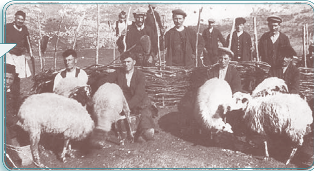
Άρμεγμα στη στρούγκα, 1930 (Από το βιβλίο "Η ζωή και η τέχνη των Σαρακατσάνων". Έκδοση ΕΟΜΜΕΧ)

«Οι άνδρες ήταν τσοπάνηδες, τσελιγκάδες όπως τους έλεγαν. Πήγαιναν τα ζώα τους για βοσκή, το χειμώνα χαμηλά στις πλαγιές και το καλοκαίρι ψηλότερα προς τις κορφές των βουνών. Πολλές φορές, για να περάσει η ώρα, κατά τη βοσκή, σκάλιζαν ξύλα και έφτιαχναν γκλίτσες, μαγκούρες δηλαδή, με όμορφα σχέδια και έβαζαν τα αρχικά τους. Άλλοτε έπαιζαν τη χειροποίητη φλογέρα τους, που ηχούσε γλυκά στις πλαγιές»!