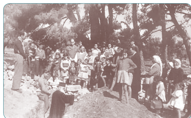
Η θεμελίωση του Δημοτικού Σχολείου Πικερμίου, (δεκαετία '50)