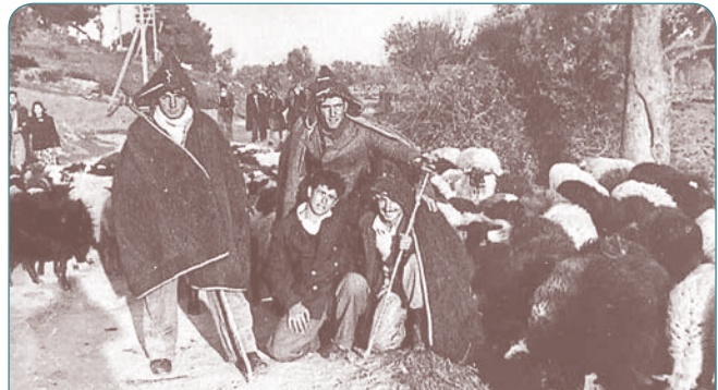
Σαρακατσάνοι κτηνοτρόφοι της Ραφήνας βόσκουν τα κοπάδια τους

Τότε στην περιοχή υπήρχε μόνο ένα κτίριο πάνω από το σημερινό λιμάνι που ήταν καζίνο και ο μικρός κόλπος του λιμανιού που έδεναν καΐκια από την Εύβοια. Δεν υπήρχαν οικισμός και καμία άλλη υποδομή. Μοναδικός υποτυπώδης οικισμός δημιουργήθηκε στη Διασταύρωση Ραφήνας, μετά το 1910, που κατοικούσαν εργάτες του εκεί λιγνιτωρυχείου (κατά πλειοψηφία Ευβοιώτες).