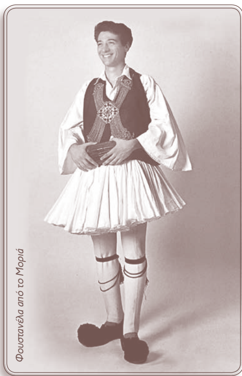
Φουστάνελα από το Μοριά

Στη Μακεδονία και τη Θράκη, το κεφάλι στολίζεται με τον μποχό , το μαύρο μάλλινο μαντήλι, ενώ στις άλλες περιοχές επικρατεί το απλό σταμπωτό τσεμπέρι με τα φυτικά θέματα. Σε μαύρο φόντο και στην Ήπειρο. Αντίθετα, από τη Θεσσαλία και κάτω το χρώμα ξανοίγει σε κίτρινο ή ζαχαρί.