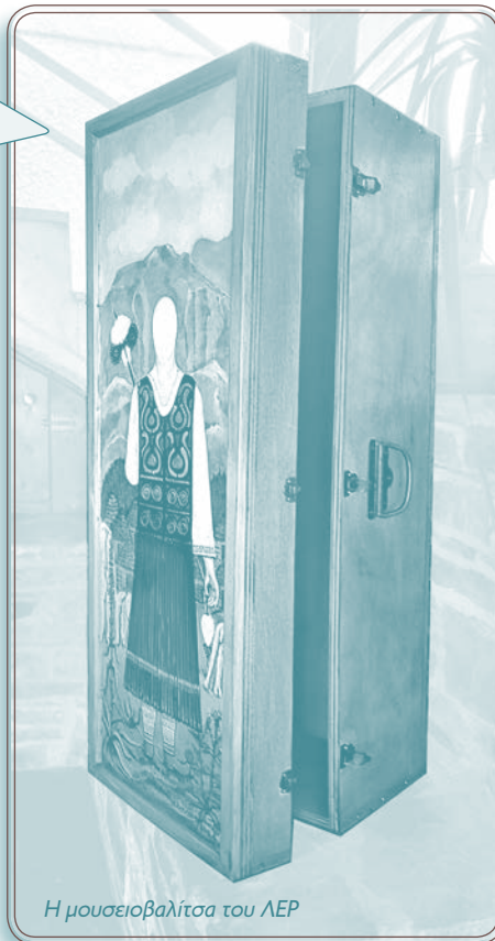
Η μουσειοβαλίτσα του ΛΕΡ

«Τη μουσειοβαλίτσα από το Λύκειο των Ελληνίδων Ραφίνας. Όταν την ανοίξουμε, θα μάθουμε πολλά για τους Σαρακατσάνους, Έλληνες που κατέβηκαν πριν από 650 χρόνια περίπου από την Πίνδο, μετακινούνταν από βουνά σε πεδιάδες, για να βοσκήσουν τα ζώα τους και έχτιζαν μόνοι τους τα σπίτια τους.»