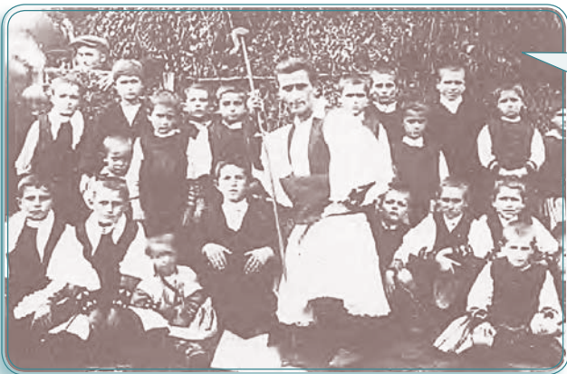
Δάσκαλος και μαθητές σε σαρακατσάνικη στάνη, μπροστά στο δασκαλοκάλυβο, για τα καλοκαιρινά μαθήματα στα βουνά. (Από το βιβλίο "Η ζωή και η τέχνη των Σαρακατσάνων". Έκδοση ΕΟΜΜΕΧ).

«Είχαν μια καλύβα, που αποτελούσε το σχολείο τους, μόνο όμως για τα αγόρια, για να μαθαίνουν βασικές γνώσεις γραφής και αριθμητικής, ώστε να εμπορεύονται ως τσελιγκάδες τα προϊόντα τους! Τα κορίτσια έμεναν κοντά στις μητέρες και τις γιαγιάδες, που τους δίδασκαν όλες τις εργασίες του σπιτιού, την υφαντική, την τυροκομία και άλλα. Συχνά οι γιαγιάδες τους διηγούνταν παραμύθια, με ιστορίες από τη ζωή των Σαρακατσάνων, με μάγισσες και φαντάσματα. Μέσα από αυτά αποκτούσαν τις αρχές και τις αξίες της ζωής, της οικογένειας, ενίσχυαν τη θρησκευτική τους πίστη, καλλιεργούσαν τον χαρακτήρα τους.