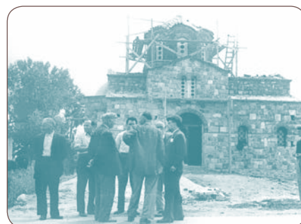
Στην ανέγερση του Ιερού Ναού του Αγίου Χριστοφόρου, στο Πικέρμι, (δεκαετία '50).