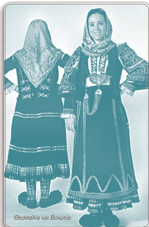
Θεσσαλία και Βοιωτία